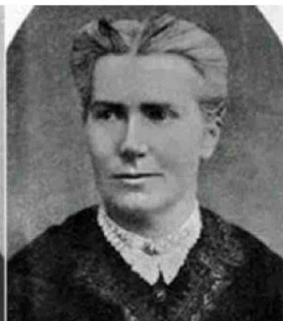
Las doctoras Marie Zakrzewska y Emily Blackwell.

mujeres embarazadas, niños y personas en situación de pobreza y vulnerabilidad.