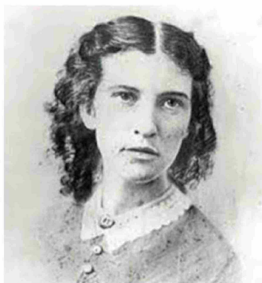
Retrato de Elizabeth Blackwell en sus años de estudiante de Medicina.

Su camino estuvo marcado por obstáculos que hoy parecen insuperables. Recibió cartas de rechazo, enfrentó discriminación abierta de profesores y colegas y debió superar la incredulidad de una sociedad que cuestionaba la capacidad de las mujeres para ejercer la ciencia. Incluso su propia familia, aunque educada y progresista, tuvo dudas sobre si iba a poder dedicarse profe-