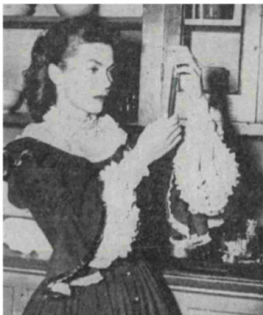
"The Blackwell Story", emitida en 1957 por CBS, llevó la vida de Elizabeth Blackwell a la pantalla, con Joanne Dru en el papel protagonista.

» Elizabeth Blackwell se graduó el 23 de enero de 1849 y rompió barreras. La mujer superó el rechazo y la discriminación, abrió consultorios para mujeres, impulsó la formación de enfermeras durante la guerra civil y participó activamente en causas sociales.