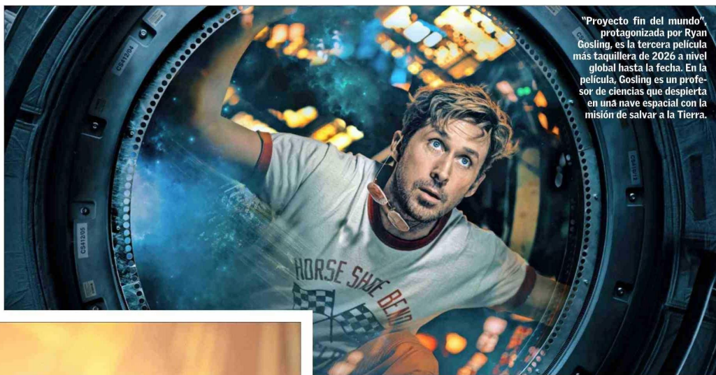
"Proyecto fin del mundo", protagonizada por Ryan Gosling, es la tercera película más taquillera de 2026 a nivel global hasta la fecha. En la película, Gosling es un profesor de ciencias que despierta en una nave espacial con la misión de salvar a la Tierra.

La película ha sido reconocida por científicos a nivel global por la manera en que aborda diferentes aspectos, algunos reales y otros que, aunque no lo son, están basados en ideas o hipótesis científicas legítimas.