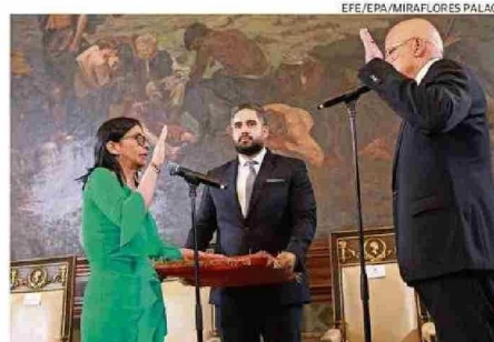
Delcy Rodríguez juró como presidenta encargada de Venezuela.