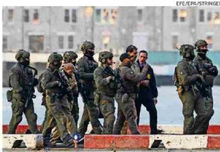
Maduro y Flores llegaron esposados y fuertemente vigilados.