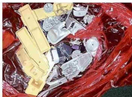
SE HALLARON "ALARMAS" YA DESPRENDIDAS DE LA PRENDAS.

En el propiedad contabilizaron 1.412 prendas de vestir de niños y adultos, algunas de las cuales aún mantenían puesto el dispositivo de seguridad