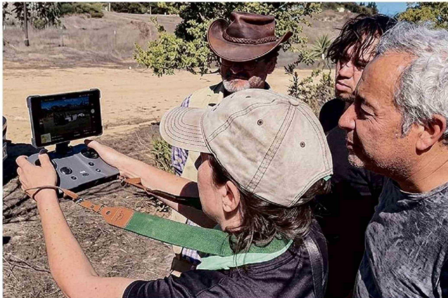
EQUIPO UTILIZA DRON PARA OBSERVAR DESDE EL AIRE LA RIQUEZA NATURAL DEL SECTOR ALTO DE SAN JUAN.

En esa línea, indicó que "en el marco de nuestro plan de protección y regeneración de la biodiversidad, desde la Fundación Quebrada del Alto estamos generando lazos de