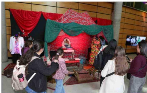
La escenografía de teleseries también provocó interés.

cas sobrenaturales. Estaban supuestamente poseídos por el demonio. Hace 200 años una crisis de epilepsia era vista como un símbolo de posesión diabólica. En este contexto, los locos eran muy mal vistos, pero más todavía las mujeres, a quienes se les aplicaba un tratamiento más