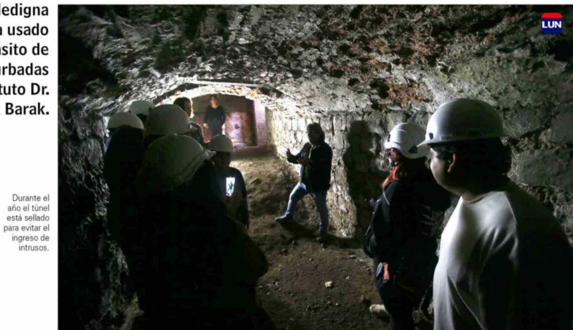
Durante el año el túnel está sellado para evitar el ingreso de intrusos.