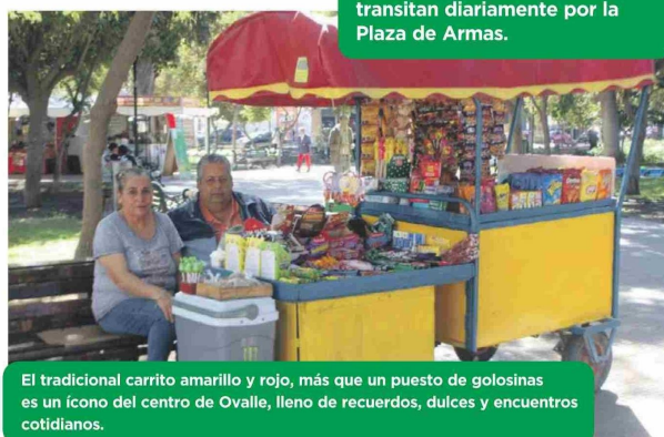
El tradicional carrito amarillo y rojo, más que un puesto de golosinas es un ícono del centro de Ovalle, lleno de recuerdos, dulces y encuentros cotidianos.

matrimonio ovalino, que con dedicación y calidez han sabido ganarse el cariño de quienes transitan diariamente por la Plaza de Armas.