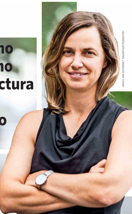
JOHN D. AND CATHERINE T. MACARTHUR FOUNDATION

Reconocida como una de las arquitectas del paisaje y diseñadoras urbanas más importantes a nivel mundial, la académica de la U. de Columbia y fundadora de Scape habla sobre la importancia de construir ciudades con una perspectiva ecológica a gran escala.