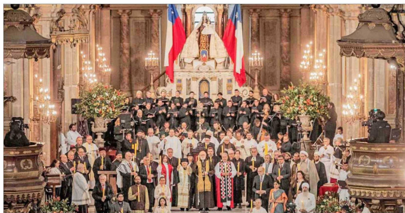
Representantes de las distintas confesiones religiosas, varias de las cuales suscribieron el documento conocido ayer, suelen reunirse en público en ocasiones como el Te Deum de Fiestas Patrias. En la imagen, el de 2023.

El texto resultante, divulgado anoche, alerta sobre un “grave deterioro” de las relaciones cívicas, un problema de inseguridad pública con “consecuencias impredecibles”, “innumerables” casos de corrupción públicos y privados, y la “incapacidad” de los actores políticos para llegar a