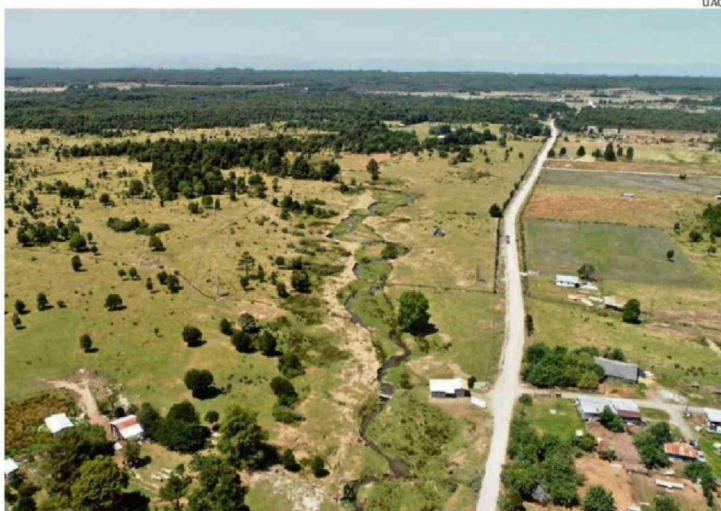
EL SITIO ARQUEOLÓGICO ESTÁ UBICADO CERCA DE PUERTO MONTT EN LA REGIÓN DE LOS LAGOS.