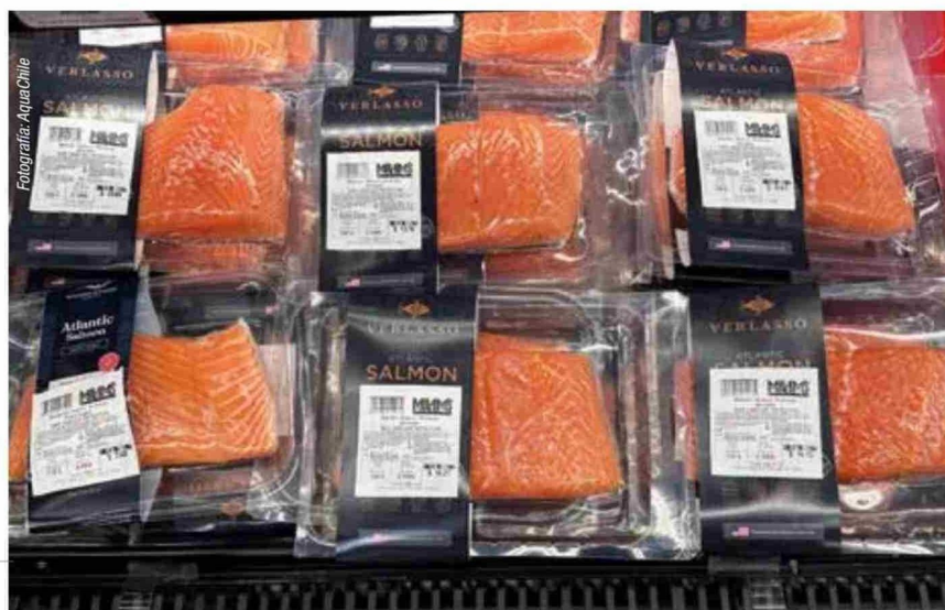
Productos de salmón chileno en EE. UU.

“Es preferible crecer un 15% en precio al mismo volumen que solo buscar un mayor volumen, debido a que podría traducirse en baja de precio y pérdida de valor para la industria”, Cooke Aquaculture Chile.