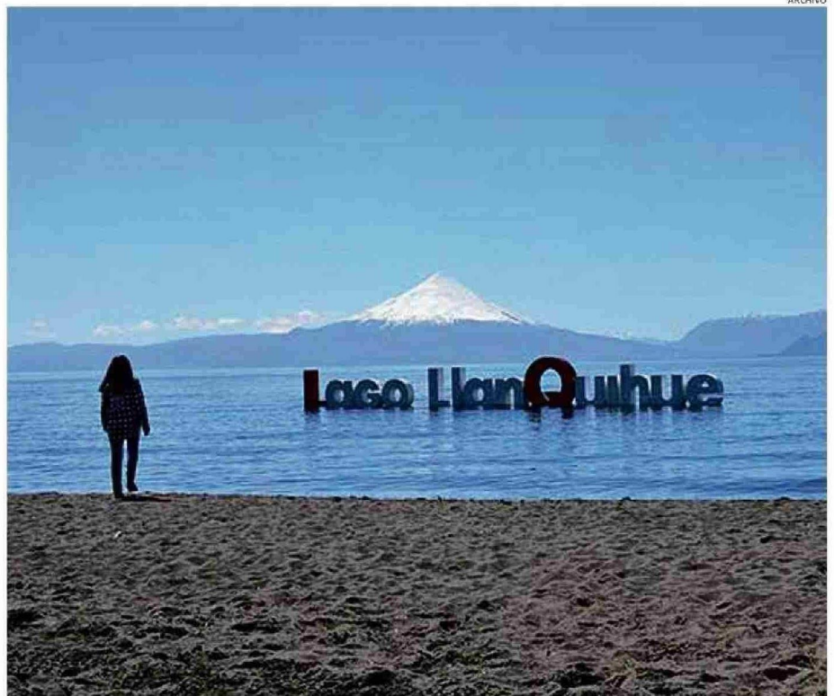
CERCA DE ESTE SECTOR SE REGISTRÓ EL INCIDENTE EL 17 DE ENERO, ES DECIR, HACE EXACTAMENTE UNA SEMANA.

Debido a que no se descartan hipótesis como la legítima defensa o la participación de terceros, y ante la falta de peritajes concluyentes en el momento —consecuencia directa