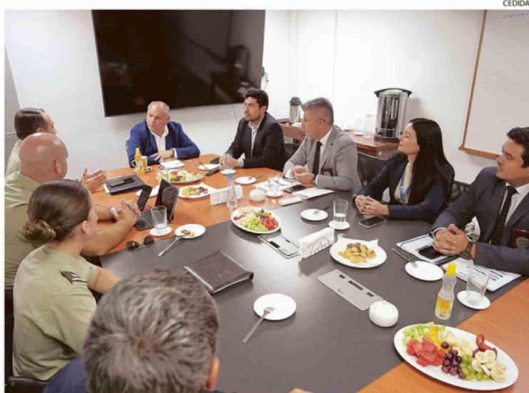
GOBIERNO REGIONAL, CARABINEROS Y PDI SE REUNIERON PARA AFINAR LOS PLANES DE EJECUCIÓN.

Respecto de los delitos que tienden a incrementarse, advirtió que “normalmente son los robos por sorpresa o lanzazos y los robos de especias al interior de vehículos”, haciendo un llamado al autocuidado.