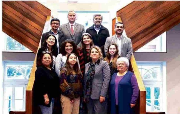
El Consejo de Sustentabilidad articula el trabajo de la UCT en estas materias.

Así es como en los últimos años se han inaugurado diversos edificios con sello verde, entre ellos el Pabellón Docente y el Campus Nuestra Señora de Lourdes (que alberga el Hospital de Simulación), espacios que reflejan cómo la universidad ha ido adaptan-