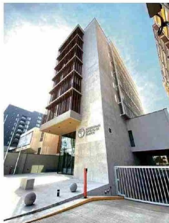
Campus Nuestra Señora de Lourdes.