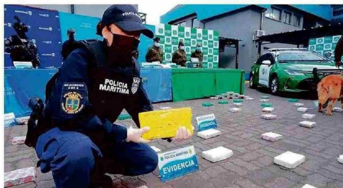
LA DROGA ESTABA PARCELADA EN 98 "LADRILLOS" DE COCAÍNA.