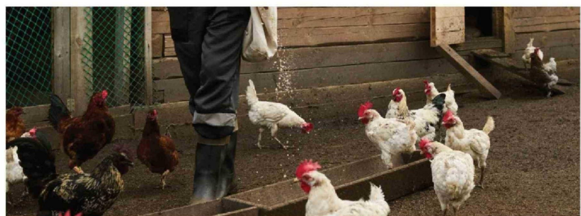
LAS AVES SILVESTRES ACTÚAN COMO los principales vectores de la influenza aviar en la zona central, iniciando contagios que puede alcanzar a planteles industriales.