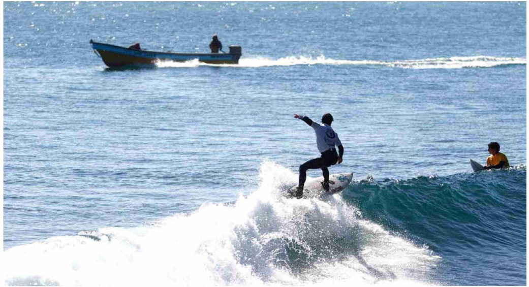
El protocolo busca evitar accidentes y garantizar la seguridad de todos los usuarios del área.

Como parte de las medidas, se instruye a los sindicatos de pesca-