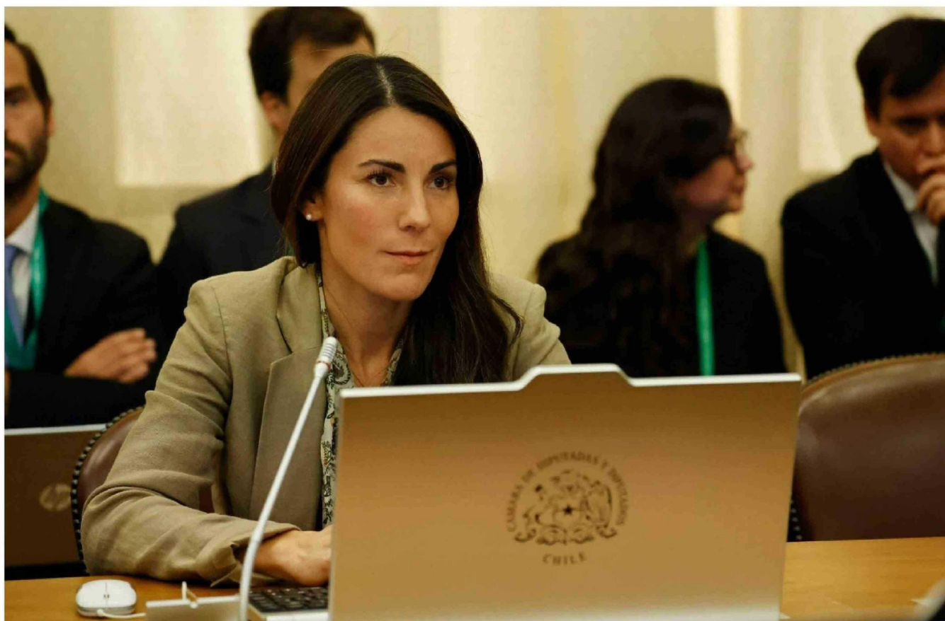
► María Paz Arzola, ministra de Educación, en la Cámara de Diputados.