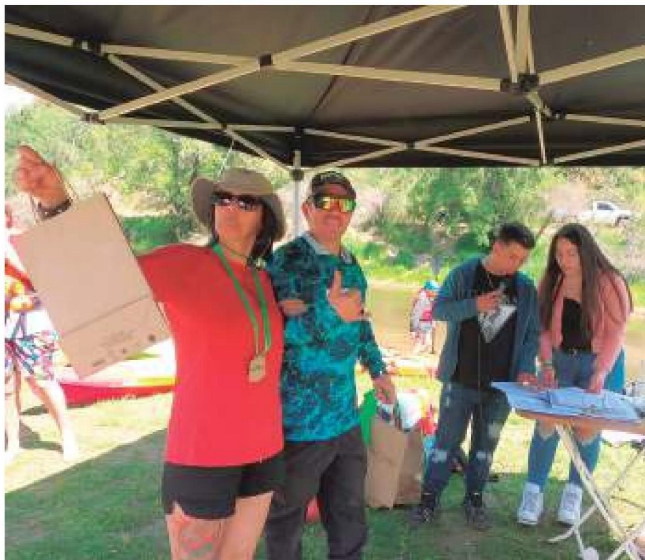
"RC Servicios" y los diversos organizadores de esta Regata entregaron premios a las y los participantes.