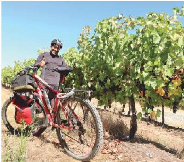
La comuna de Rauco tiene distintas rutas para pedalear, muchas de ellas hoy se realizan entre sus viñas.

Ubicada en el extremo norte del Valle Central de nuestra región y amurallada al oeste por la formidable Cordillera de la Costa y al este por el área urbana de Curicó, la comuna de Rauco no aparece en el itinerario de las rutas preferidas por la inmensa mayoría de ustedes, amigos(as) y amantes de nuestra región, su cultura identitaria y los deportes con sello sustentable. No nos sorprende, en absoluto, dado que esto mismo le sucede a otras comunas que con un marcado sello rural han sido herméticamente silenciadas por la oferta de la industria turística nacional, que releva selectivamente sólo algunos hitos de nuestra región, como por ejemplo el Radal, el río Achibueno, o las costas de Iloca y Constitución. Así ¿cuándo se desarrollará nuestra región si la mayoría de sus habitantes desconocen los innumerables encantos silenciosos que posee? Intentando ser un aporte en ello, la agrupación Cicloturismo Chile Profundo emprendió el desafío de relevar los atractivos del patrimonio de la comuna de Rauco, ya que cada territorio de la región es digno de ser apreciado y disfrutado sobre todo en bicicleta.