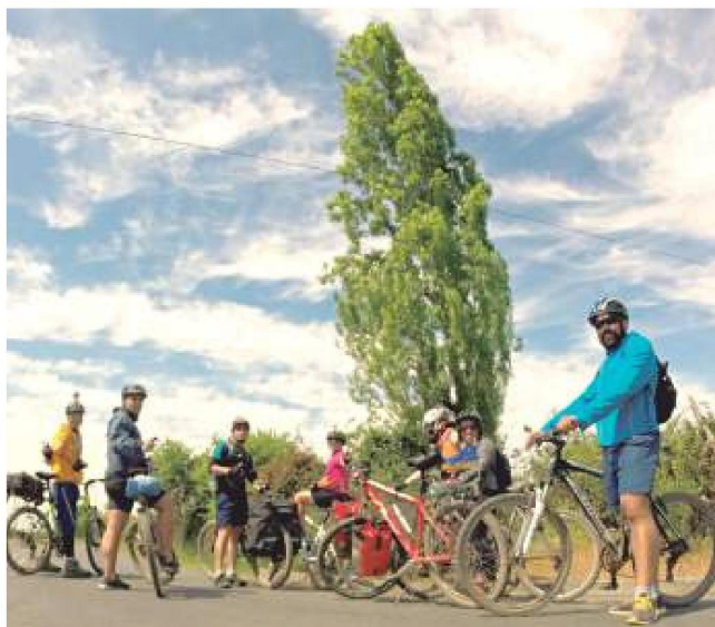
En la localidad de “Los Alisos” podemos disfrutar de las bondades de su territorio rural.

Esta ruta se desarrolla al suroeste de la ciudad de Rauco, y si quisiéramos hacer más largo el viaje, éste nos conectaría con Hualañé, la costa (Licantén) o los lagos (Vichuquén). En nuestro caso nos dirigimos hasta “La Vinilla” por la ruta asfaltada, mientras que el retorno a Rauco lo realizamos siguiendo un camino de tierra que está a los pies de las formaciones rocosas de la Cordillera de la Costa. Esta ruta es muy emocionante por los atractivos del paisaje patrimonial que posee al comienzo. Pensábamos en el ramal ferroviario que tenemos funcionando en Talca, imaginando las posibles semejanzas o diferencias con el que aquí existió y del cual se conservan algunos vestigios como parte de la “Estación de Quilpoco.” En la segunda parte de esta ruta, el vértigo que tienen los ascensos y descensos en la misma nos encantaron, pero lo que más nos sorprendió fue lo acogedora que es la gente que nos encontramos en medio de los campos que recorrimos sobre nuestras bicicletas en Rauco, nos atendieron muy cortésmente, la gente se interesaba con curiosidad al vernos y se acercaba a preguntarnos qué hacíamos allí. Al explicarles nuestros motivos nos daban su apoyo para poder llevar a cabo de manera efectiva este proyecto que emprendíamos.