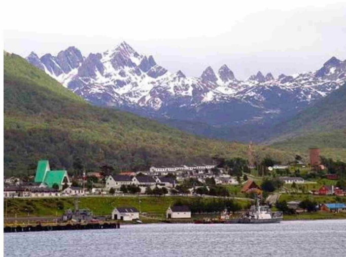
Puerto Williams es la ciudad más austral del mundo, con una fuerte proyección antártica.

El aislamiento no es una fatalidad en Magallanes, es un problema de diseño. Una región que tiene mar en casi todos sus costados no debería sentir que el mundo le da la espalda, pero durante décadas esa ha sido la experiencia de sus habitantes. Las rutas aéreas con conexiones escasas, las carreteras que se cortan por la frontera binacional y con las lluvias o la nieve, los precios inflados por el costo del flete: todo eso configura una cotidianidad marcada por la distancia. El mar, paradójicamente, es la solución que más cerca ha estado siempre y que menos se ha aprovecha-