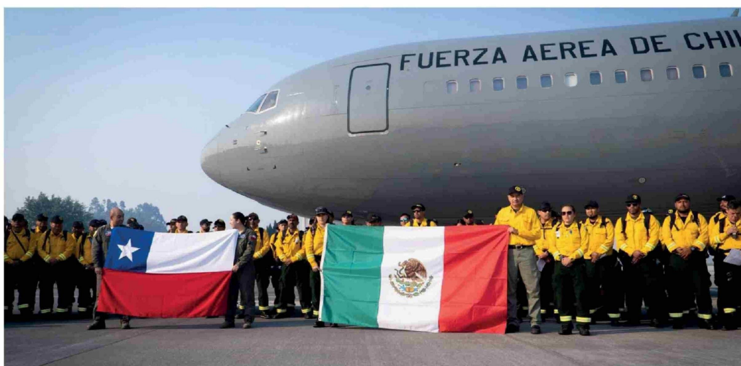
UN TOTAL DE 145 BRIGADISTAS FORESTALES mexicanos llegaron a la región del Biobío el pasado jueves. Permanecerán en la zona por al menos 20 días.

Una coordinación entre Chile y México permitió la llegada de 145 brigadistas forestales con más de 360 kilogramos de equipo especializado el pasado jueves. El acuerdo inicial de permanencia es por 20 días, para contener la emergencia que ha dejado más de 32.000 hectáreas quemadas en la región, 21 víctimas fatales y cientos de damnificados.