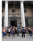
A la falta de electricidad y combustible en Cuba se suma la escasez de efectivo en los bancos, como lo atestiguan las largas colas, principalmente de personas mayores, que por horas se agolpan ante las sucursales. | A 6

> La rectora Rosa Devés advierte sobre la polarización, "que tiende a reducir al otro a un adversario antes que a un interlocutor legítimo. Esta dinámica se expresa en la radicalización del debate público y en una progresiva pérdida de la escucha". | C 1