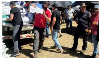
DESDE EL MUNICIPIO ASEGURARON CONTINUARÁN GESTIONANDO APO- YOS Y COORDINANDO ACCIONES INTERINSTITUCIONALES PARA AVAN- ZAR EN LA RECUPERACIÓN PRODUCTIVA DE LAS FAMILIAS Y SECTORES RURALES AFECTADOS.

El imputado quedó a disposi- ción del Juzgado de Garantía de Temuco para su correspondien- te audiencia de control de la de- tención. c3