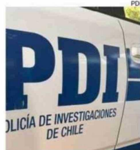
DILIGENCIAS FUERON REALIZADAS POR LA PDI.

Por este motivo, oficiales poli- ciales de la PDI concertaron un encuentro con el vendedor de la especie en el macro sector Pe- dro de Valdivia, siendo recupe- rado el reloj que correspondía al sustraído y detenido el involu- crado al no poder acreditar pro- cedencia de esté. c3