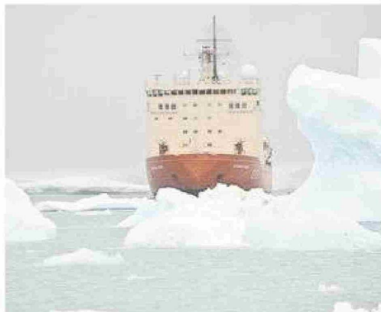
El rompehielos "Almirante Irizar" en tareas logísticas antárticas.