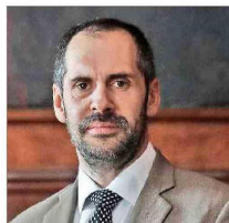
Nicolás Grau, ministro de Hacienda.

por lo mismo, se han implementado mejoras "metodológicas, procedimentales y de transparencia" relacionadas con la asistencia técnica que recibieron del Fondo Monetario Internacional (FMI). Sin embargo, Montero atribuye la situación más bien a "una mala proyección sistemática de los ingresos fiscales, lo cual, en todo caso, fue advertido en reiteradas ocasiones, desde diversos sectores, y también desde el propio Consejo Fiscal Autónomo (CFA). Por lo tanto,