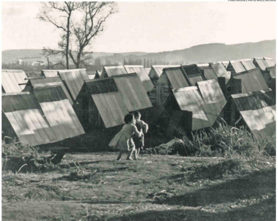
LOS RUCOS FUERON LA SOLUCIÓN HABITACIONAL PARA LOS DAMNIFICADOS DEL DESASTRE QUE LE CAMBIÓ LA CARA A VALDIVIA Y A LA MACROZONA SUR.