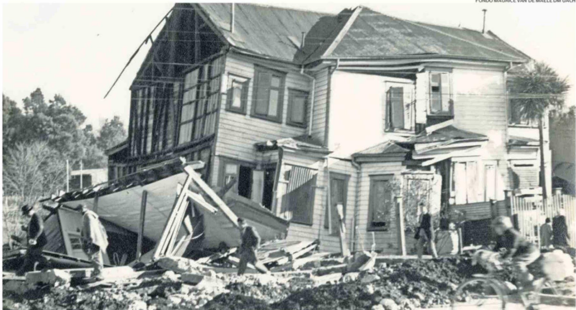
FONDO MAURICE VAN DE MAELE TIENE FOTOS DE SU AUTORÍA Y ES DE ACCESO PÚBLICO EN EL MUSEO HISTÓRICO Y ANTROPOLÓGICO UACH.

De ambos autores es también "Valdivia 9.5: Historias de una catástrofe" (Libros Verde Vivo Valdivia, 2026) que apunta al recuerdo de la tragedia con datos curiosos e información poco conocida. Es el resultado de una investigación bibliográfica con fuentes como