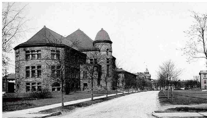
UNIVERSIDAD DE MINNESOTA, ESTADOS UNIDOS (1945).

En la Convención Nacional de Periodistas fue uno de los presidentes