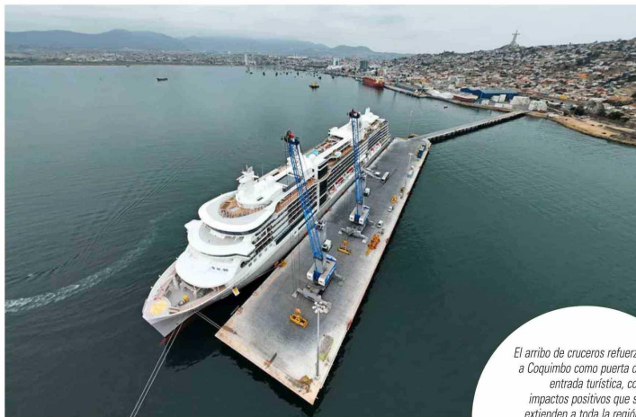
El arribo de cruceros refuerza a Coquimbo como puerta de entrada turística, con impactos positivos que se extienden a toda la región.