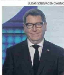
EL MINISTRO DANIEL MAS.