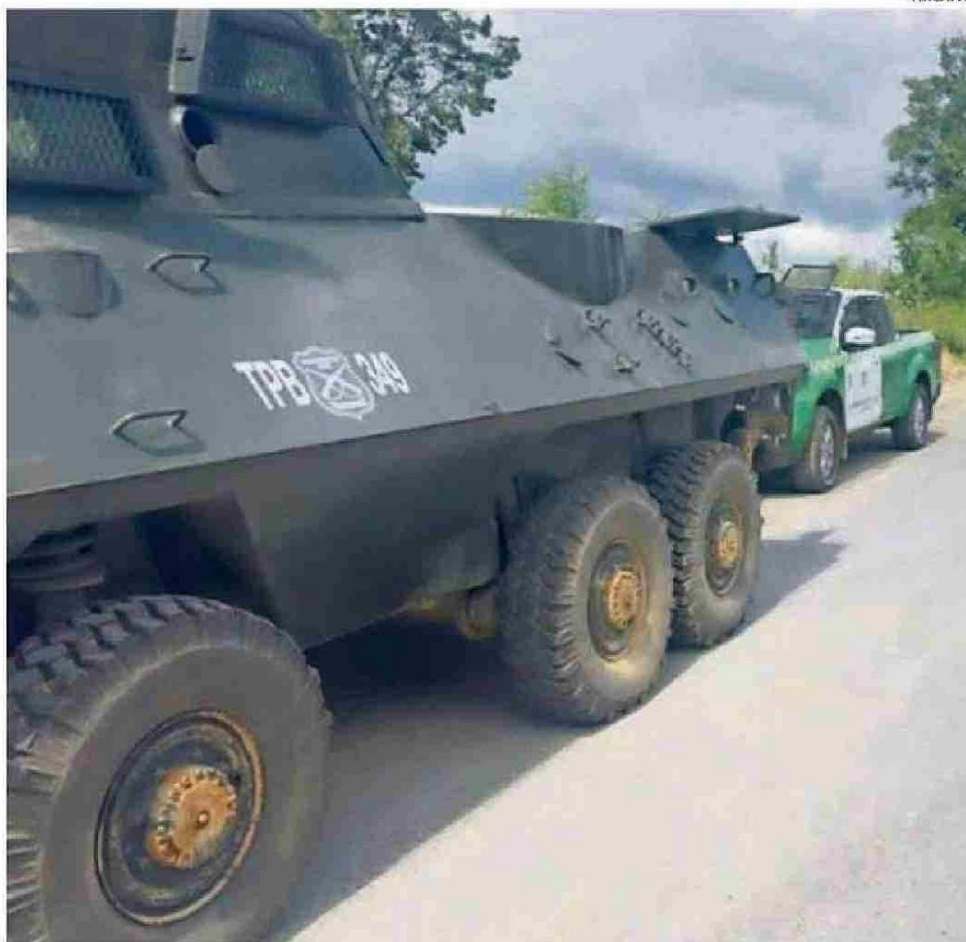
EL HECHO OCURRIÓ EN EL KILÓMETRO 6 DEL CAMINO ERCILLA-VICTORIA POR LA TURBINA Y TEMUCUCUI.

Un comunicado emitido por la Asociación de Funcionarios de la Salud Municipal de