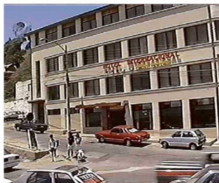
INMUEBLE FUE UN ICÓN DEL SECTOR DE PLAYA AMARILLA.

eventual recuperación de la infraestructura durante los periodos en que lideró la administración comunal, precisó que "se había presentado un proyecto con una maqueta y todo por parte del dueño del terreno, que incluso fue aprobado", el cual contemplaba el uso de un terreno contiguo para construir el estacionamiento del hotel.