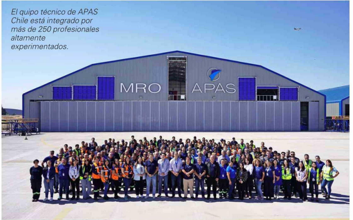
El equipo técnico de APAS Chile está integrado por más de 250 profesionales altamente experimentados.

"Como parte de nuestro plan de expansión, APAS Chile está desarrollando 100.000 m 2 adicionales de losa para sus operaciones y construyendo dos