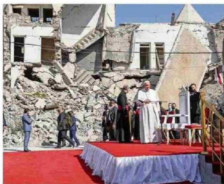
VISITA A LAS RUINAS DE MOSUL, IRAK, DONDE VIVE LA MINORÍA CRISTIANA.