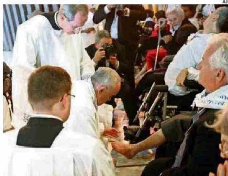
EL PAPA SORPRENDIÓ LAVANDO LOS PIES A RECLUSOS Y POSTRADOS.

MURIÓ EL PAPA. El rezo en solitario en plena pandemia, su visita a Chile o su segunda encíclica, entre lo más destacado.