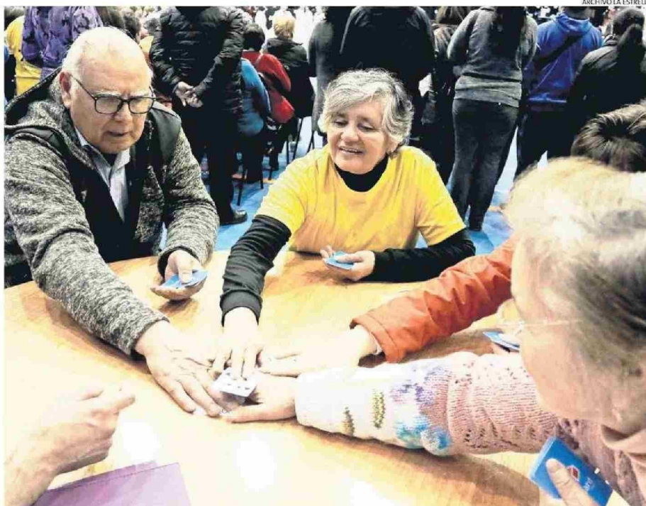
FORTALECER SUS REDES COMUNITARIAS ES PARTE IMPORTANTE PARA MEJORAR LA VIDA DE LAS PERSONAS MAYORES, DESTACA SÁNCHEZ.

"Desde el Hogar de Cristo lo constatamos en nuestras 70 comunas de presencia —puntualizó— y especialmente en las seis del Biobío donde atendemos a personas mayores a través de servicios sociales especializados. Frente a este escenario, necesitamos más socios y más compromiso para sostener y ampliar los programas de apoyo y cuidado. Porque estas cifras no son solo estadísticas, son per-