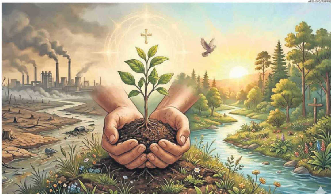
“LA PERSPECTIVA EUCARÍSTICA INVITA A CONTEMPLAR EL MUNDO NO COMO UN OBJETO INERTE DE EXPLOTACIÓN, SINO COMO UN DON SAGRADO QUE DEBE SER RECIBIDO CON GRATITUD...”

Al distorsionar el concepto bíblico de «dominio», la humanidad moderna ha intentado erigirse en dueña absoluta de la historia y el cosmos, reduciendo