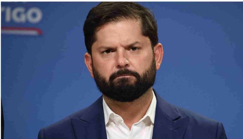
► El Presidente Boric cuestionó la intervención de EE.UU. en Venezuela.

"Respaldo la posición del gobierno. Es una posición de principios apegada al derecho