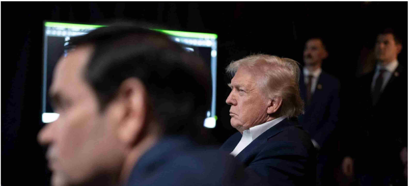
► El presidente Donald Trump supervisa las operaciones militares estadounidenses en Venezuela desde el Club Mar-a-Lago en Palm Beach, Florida, el 3 de enero de 2026.