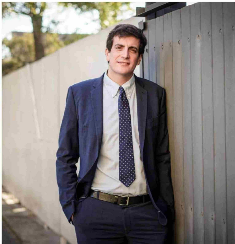
► El diputado RN e integrante de la Comisión de RR.EE. de la Cámara, Diego Schalper.

Título: El precedente que puede generar la acción de Trump en Caracas según analistas