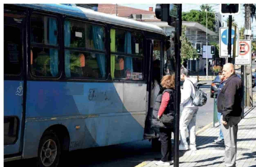
LOS CHOFERES DEL TRANSPORTE mayor también aspiran a mejorar sus condiciones.

“Esta semana nuestros socios están viendo la mejor marca para ingresar, así que en lo que queda de este año ya se empieza a notar un cambio para mejorar en Los Ángeles”, concluyó.