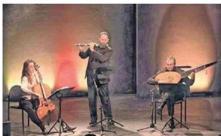
Hermenéutica Armónica destaca en el medio de la música antigua.

Es así que hoy la cita se dividirá en tres bloques: de 9 a 13, se realizarán actividades prácticas en el Colegio Médico local. Luego, desde las 15 horas, en el mismo audi-