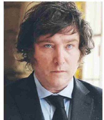
Javier Milei propone más de 60 reformas.

temas latinoamericanos de la Facultad de Ciencias Económicas y Empresariales de la Universidad de los Andes.