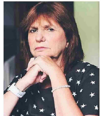
Patricia Bullrich, de Juntos por el Cambio.