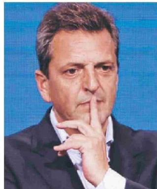
Sergio Massa es el candidato oficialista.