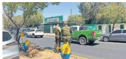
HABLÓ MADRE DE ALUMNO QUE AGREDIÓ CON ARMA BLANCA EN LEZAETA

En este aspecto, resulta primordial el espacio destinado a la oración y reflexión valórica que promueve la unión, la esperanza y un ambiente seguro dispuesto por la dirección administrativa del colegio, tal como ocurrió en la jornada de ayer, con los alumnos de 1° a 5° años de la enseñanza básica, y que se replicará con el resto de los estudiantes en este retorno gradual a la "normalidad".