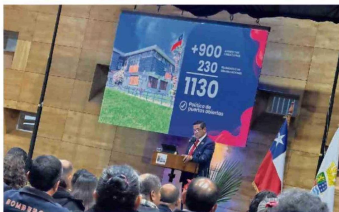
LOS ALCALDES DE LA REGIÓN ABORDARON LA GESTIÓN REALIZADA EN 2025 EN SUS COMUNAS Y PROYECTARON TAMBIÉN LAS TAREAS E INVERSIÓN PARA ESTE AÑO.

DURANTE ABRIL. De acuerdo con lo que mandata la Ley 18.675, los jefes comunales informaron ante el Concejo Municipal y la comunidad los avances en materia de obras, proyectos y el gasto ejecutado.