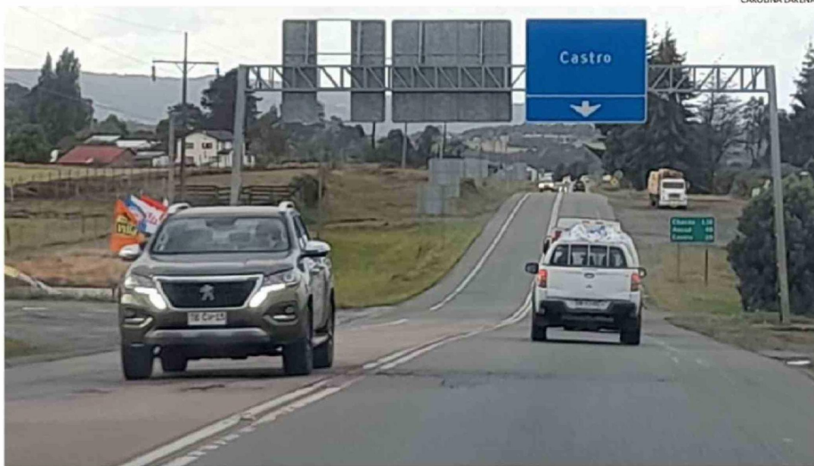
EL TRAMO DE LA PANAMERICANA ENTRE CHONCHI Y QUELLÓN ACTUALMENTE SE ENCUENTRA EN LA FASE DE ESTUDIO INTEGRAL.

Seremi de Obras Públicas se reunió con siete alcaldes de la provincia para revisar las urgencias de cada comuna, sobre todo en conectividad y agua potable rural, instancia en la que se abordaron también temas como el tramo que aún no tiene un proyecto formal para “completar” el ensanchamiento de la Panamericana, en el sur de la Isla.