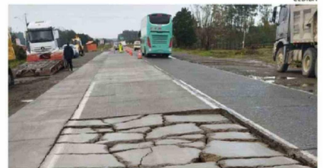
EL TRAMO ANCUD-DEGAÑA DE LA RUTA 5 TIENE COMPLICACIONES.