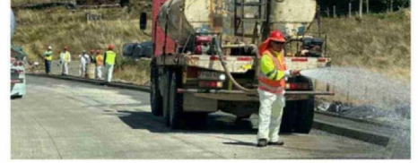
AÚN RESTAN ALGUNOS TRABAJOS EN EL BYPASS DE CASTRO.

ría destacó que “esta gira que hemos estado haciendo es para poder conversar con cada uno de los alcaldes, conocer sus urgencias e iniciativas que hay en cada municipio y aquellas cosas que son importantes en cada una de estas comunas”.