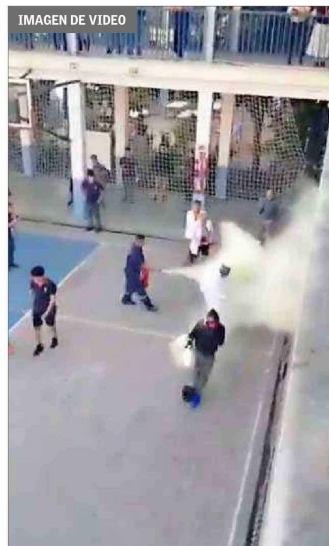
DISUASIÓN.— Un auxiliar del liceo accionó un extintor contra uno de los manifestantes.