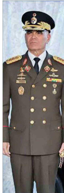
PADRINO , jefe de las FF.AA., fue destituido ayer por Delcy Rodríguez.

Padrino López fue durante años el pilar castrense del chavis-