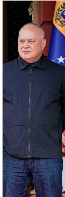
CABELLO , funcionario de la era de Maduro, conserva su cargo.

mo y uno de los pocos estrechos aliados de Maduro que permanecían en el gobierno interino de Delcy Rodríguez. Militar venezolano de carrera, llegó al poder en 2012 cuando Hugo Chávez lo ascendió a segundo comandante del Ejército y jefe del Estado Mayor. Un año más tarde, con Maduro, fue promovido a general en jefe y, en 2014, asumió en el Ministerio de Defensa, tiempo en el que los militares comenzaron a ejercer importante control sobre sectores clave de la economía como minería y petróleo.