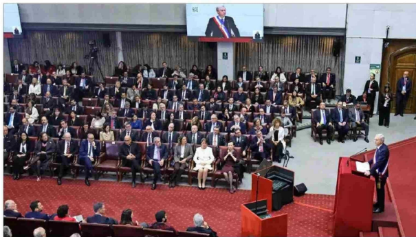
Dos horas y 25 minutos duró el discurso del mandatario. El documento preparado por el jefe de Estado tenía 27 páginas, aunque improvisó en algunos pasajes. Mientras se efectuaba la ceremonia, hubo movilizaciones afuera del Congreso, en la Plaza Baquedano y en liceos.

"Emergencia" social Sitúa a la familia como un pilar y advierte que "muchos de nuestros problemas" tienen relación con su "debilitamiento".