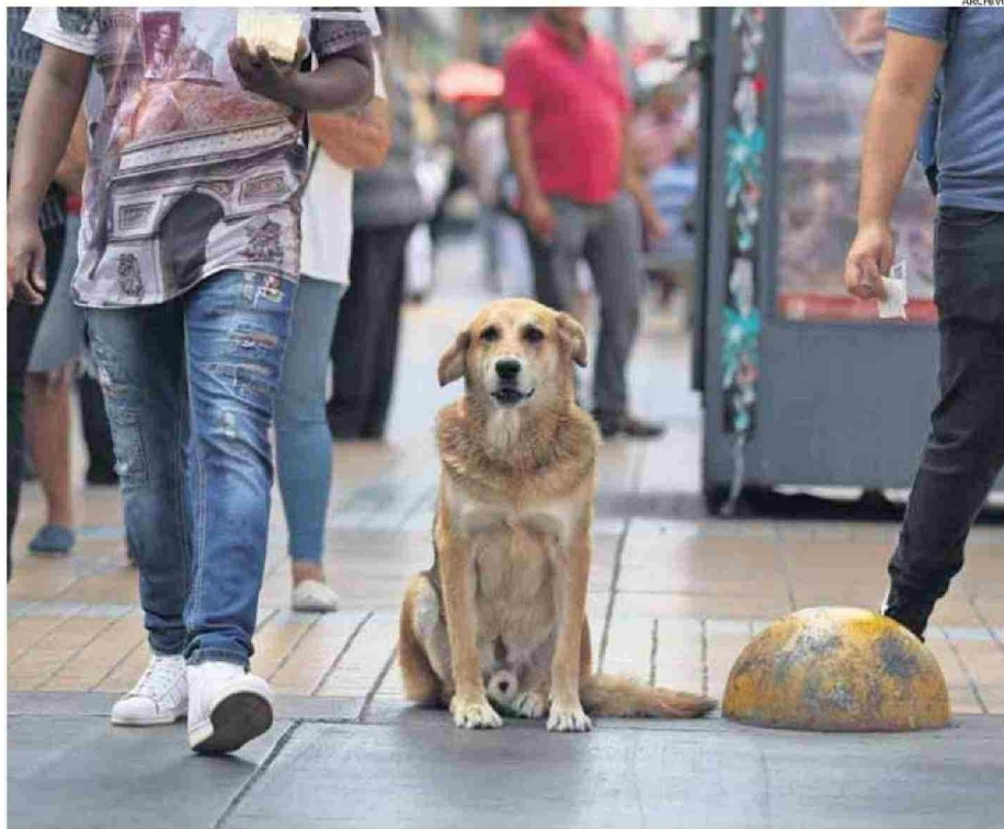
RECURSO DE LA MUNICIPALIDAD DE SAN PEDRO ABRIÓ EL DEBATE SOBRE LAS ACCIONES FRENTE A PERROS CALLEJEROS.