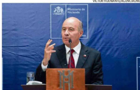
MINISTRO QUIROZ SUMÓ MEDIDAS A LAS ANUNCIADAS POR KAST.

mentó las amenazas del PS y la DC de recurrir al TC si no se separa el proyecto. “No tiene ninguna lógica lo que están planteando y que lo hagan antes de leer el proyecto me parece absurdo”, catalogó.