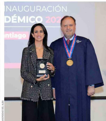
UNIVERSIDAD DEL ALBA