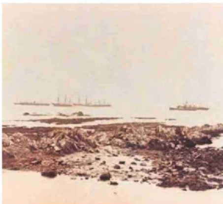
COSTAS DE ANTOFAGASTA EN 1879, LAS QUE VIERON LA APARICIÓN DEL MONITOR AL MANDO DE MIGUEL GRAU SEMINARIO.