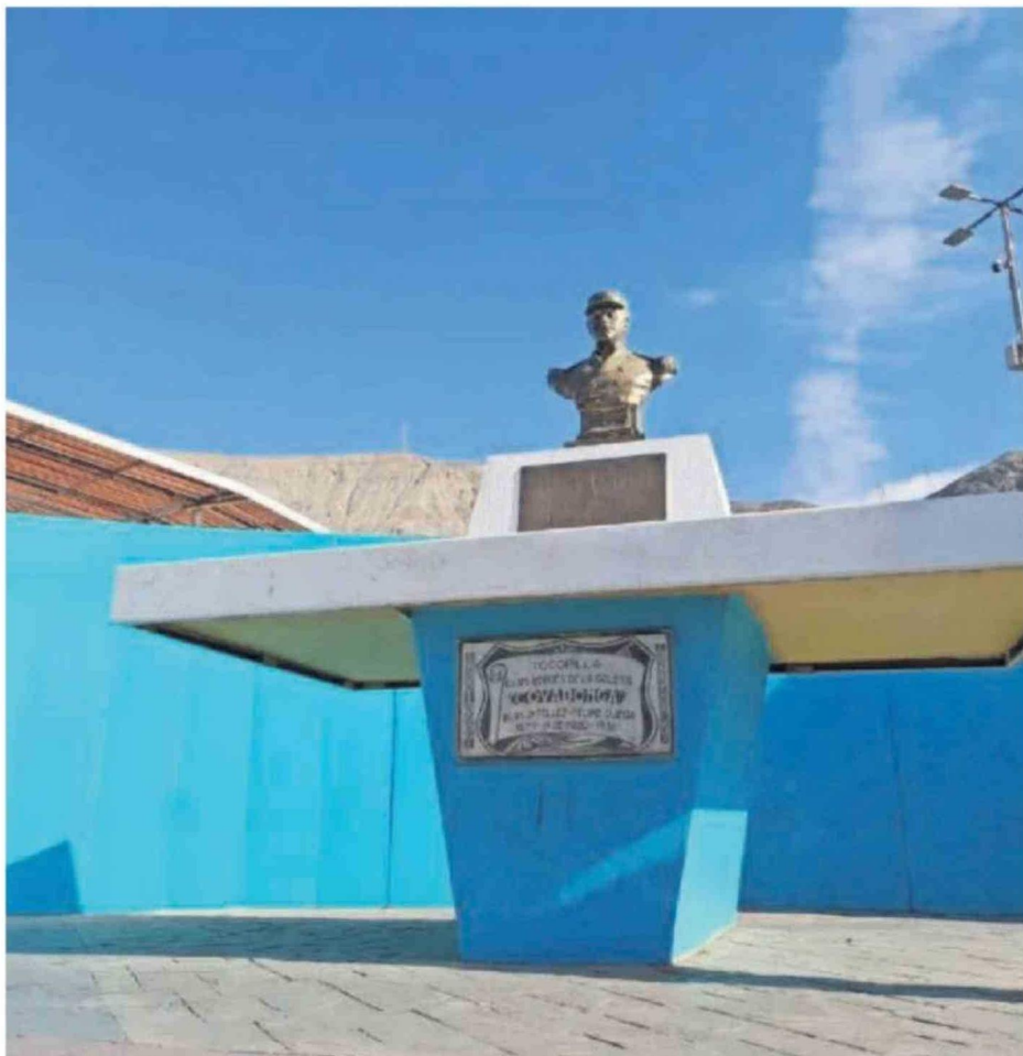
EN ESTA CRIPTA, UBICADA EN LA PLAZA CENTRAL DE TOCOPILLA DESCANSAN LOS RESTOS DE BLAS TÉLLEZ Y FELIPE OJEDA, DOS TRIPULANTES DE LA COVADONGA QUE MURIERON DURANTE EL INICIO DEL COMBATE DE IQUIQUE, EL 21 DE MAYO DE 1879.

zar por algunos días las actividades logísticas del Ejército de Chile en Antofagasta. Este enfrentamiento se volvería a registrar el 28 de agosto de ese año, pero éste último se cobraría 10 muertos.