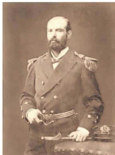
APARTE DE MARINO Y HÉROE, PRAT TAMBIÉN EJERCIÓ LA ABOGACÍA Y ERA UN EBANISTA AFICIONADO.

También agrega que "en 1872 Prat comenzó a estudiar derecho en la Universidad de Chile. El 26 de julio de 1876 se publica su tesis 'Observaciones a la Ley electoral Vigente', también requisito para licenciarse en derecho y que contenía aspectos para otorgar el voto a la mujer, algo impensado para la época. Se fija el día 31 de julio de 1876 para que rindiera su examen final. Ante la presencia del presidente de la Corte Suprema, don Manuel Montt, este oficial de la Armada de Chile, vestido con uniforme de presentación, pero sin su espada, aprueba su examen y jura como nuevo abogado de la República de Chile".