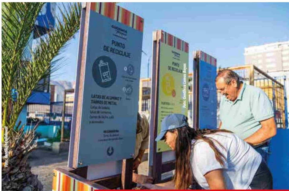
Integrando economía circular en Iquique.

instalados en Chuquicamata, fabricados con más de 17 toneladas de plástico revalorizado, proveniente de tuberías de polietileno de alta densidad fuera de uso.